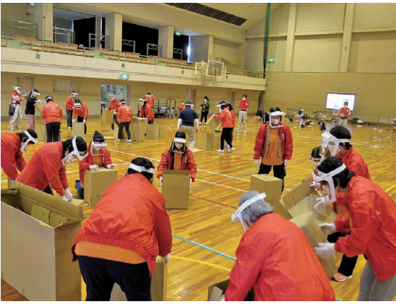
災害救護訓練の様子

赤十字奉仕団の活動として、令和2年10月29日（木）に、日本赤十字社山梨県支部主催の災害救護訓練が笛吹市にて行われました。