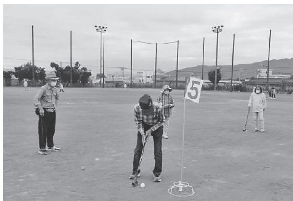
グラウンドゴルフ大会の様子