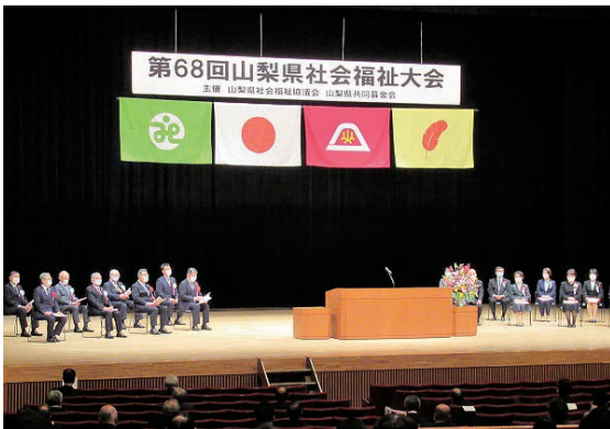
感染対策をして開催された大会

式典では、日頃から社会福祉活動に貢献された方々が表彰、感謝状等を受賞されました。