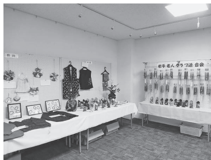
＜昨年度の作品展の様子＞