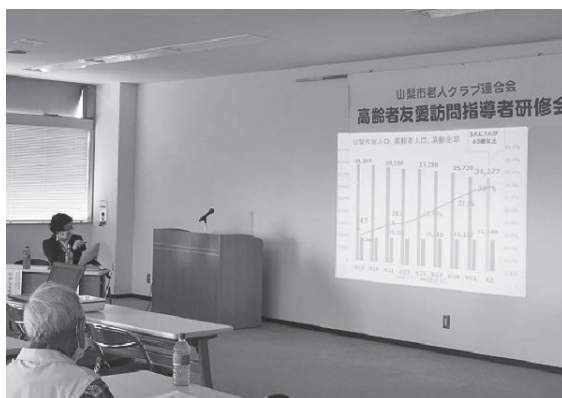
地域包括支援担当による講義