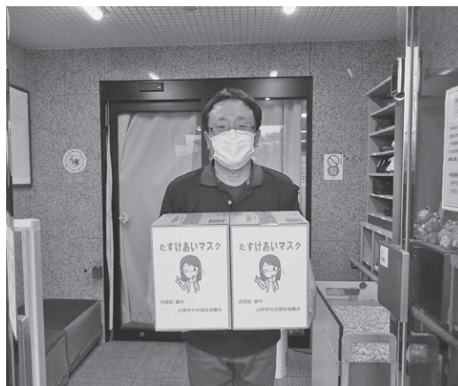
ゆららかデイサービス様

お届け先として、障害者入所支援施設白樺園様、サンコート山梨デイサービス様、ゆららかデイサービス様へお伺いしてマスクをお渡ししました。