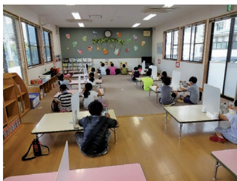
学童クラブの様子

また、9月7日(月)には児童センター・学童クラブ職員を対象に新型コロナウイルス感染症の知識や発生時の対応等を習得するため、感染防止対策の研修会を実施しました。