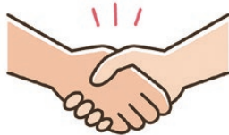
山梨クリナーズさまへ