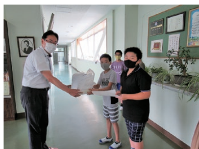
八幡小学校の 児童さんから

8月下旬には、本社協職員が施設へ訪問して、皆さまからいただいたマスクを届けてまいりました。少しでも感染を防ぐことによって元の生活に近づくようみんなで力を合わせましょう。