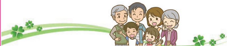
新事務所レイアウト

これからも地域福祉推進の拠点として「ふれあいを大切に ともに生き ともに支える やさしい地域づくり」を進めてまいります。