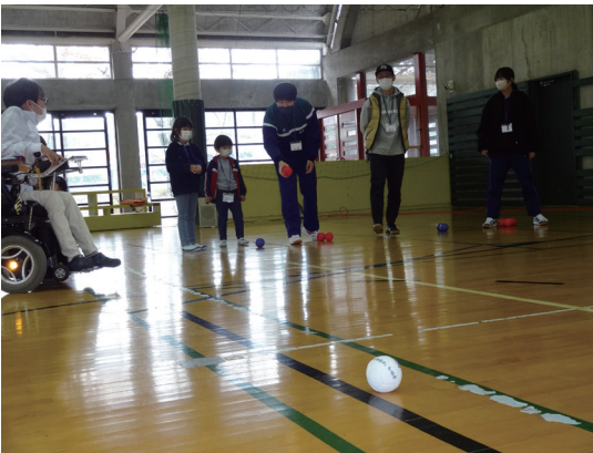
ボッチャ体験会の様子

11月5日(土) 山梨県ボッチャ協会の全面協力のもと、ボッチャ体験会を行いました。幼児から大人まで幅広い年齢の方16名が参加しました。また、山梨高校の生徒さん4名も運営ボランティアとして活動をしました。 ボッチャ協会の選手の方々のデモンストラーションの後、各コートに分かれてペアによるリーグ戦を行い、白熱したゲームが展開されました。 社会福祉協議会では、誰でも楽しめるパラスポーツの普及啓発をこれからも行っていきます。