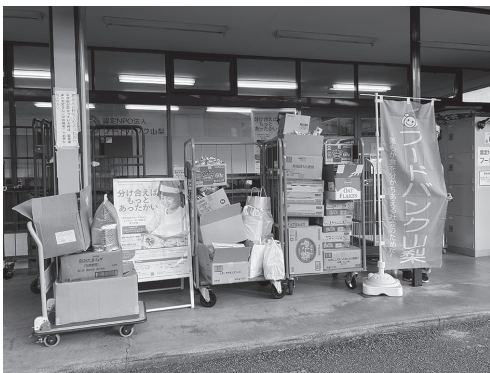
お寄せいただいた食品の数々