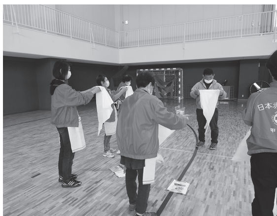
災害救護訓練の様子