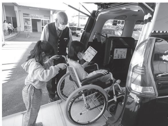
バリアフリー教室の様子