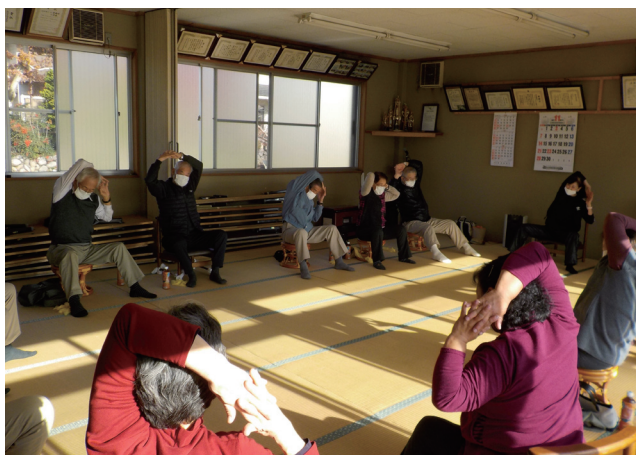
小原東4区サロンの様子

少しづつではありますが見え、サロンを再開する地域も増えていきます。感染症対策を施しながら、みんなで集う時間を楽しみませんか。社協はこれからもふれあい・いきいきサロンを支援していきます。