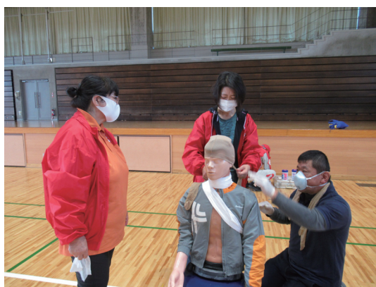
災害救護訓練の様子