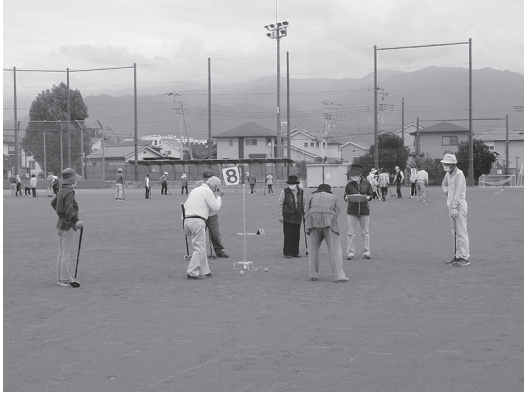
グラウンドゴルフ大会の様子

全10チームが参加し、優勝・日川地区、準優勝・西保地区、3位・三富地区という結果となりました。来年のねんりんピックでの健闘を期待します。