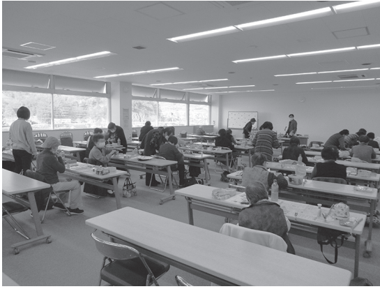
手芸活動指導者研修会の様子