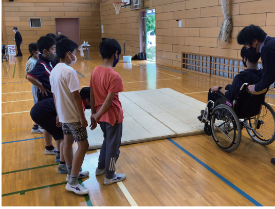
車いすの操作を見つめる児童

5月21日（金）日川小学校5年生を対象に、関東運輸局山梨運輸支局主催の「バリアフリー教室」が開催されました。ノンステップバスやユニバーサルデザインタクシーの乗降体験、アイマスク体験、車いす体験が行われ、本市社協でも車いす操作とアイマスク体験、白杖の取り扱いを説明しました。