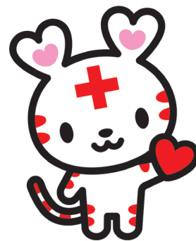
マスコットキャラクター ハートラちゃん

会費（年額） 500円以上ですが、1,000円以上の会費を納めてくださる会員の加入促進をお願いします。